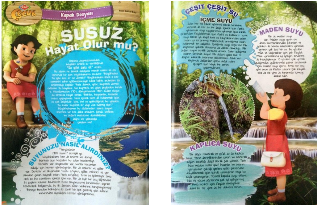
Şekil 8. TRT Çocuk Dergisinde Yer Alan “Kapak Konusu”nun Dergide İşleniş Şekli

“Dilimden Düşmeyenler” ve “Doğal Bulmaca” bölümlerinin aylara göre konu başlıkları Tablo 6’da derlenmiştir. “Dilimden Düşmeyenler” bölümü, Türk ve Dünya Edebiyatının seçkin aktörleri ve eserlerinin tanıtımının yapıldığı, eserin ana teması ile ilgili çizimlerin yer aldığı bir bölümdür. “Doğal Bulmaca” bölümünde ise her ay farklı bir hayvan ile ilgili bilgi verilmektedir. Bu bölümün sonunda ayrıca o hayvanla ilgili bulmacaya yer verilmektedir.