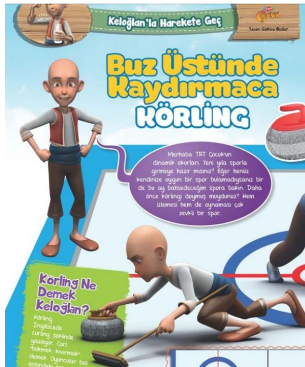
Şekil 6. Keloğlan'la Harekete Geç Bölümünün Görseli

"Kösteban'ın Rotası" ve "Keloğlan'la Harekete Geç" bölümlerinde yer alan konuların dağılımı aylara göre Tablo 4'te derlenmiştir. Tablo 4'te de görüldüğü gibi "Keloğlan'la Harekete Geç" bölümünde genellikle çocukların bilgisayar başında değil, sokakta ya da bir spor okulunda vakit geçirmelerini hedefleyen, hareket temelli oyunlar tanıtılmaya ve kuralları öğretilmeye çalışılmaktadır. "Kösteban'ın Rotası" bölümünde ise farklı