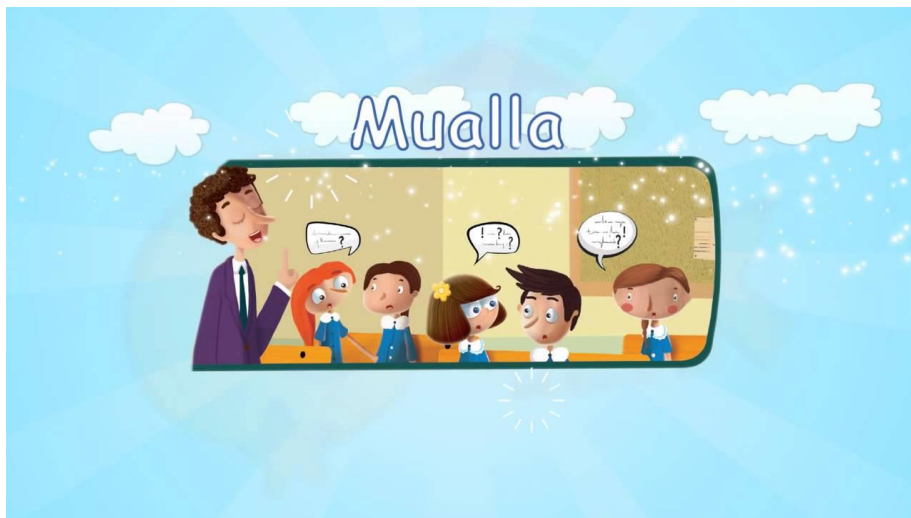
Şekil 5. TRT Çocuk Dergisinde Yer Alan “Selim ve Pelin Muhteşem Mualla” Bölümünün Görseli

“Muhteşem Mualla” ve “Selim ve Pelin” bölümlerinin yanı sıra “İbi ile Tosi'nin Gezi Notları” ve “Köstebeğgiller” bölümlerinin konu detayları aylara göre Tablo 3'te derlenmiştir. Genel hatları ile incelendiğinde, derginin içindekiler bölümünden sonra ilk sayfasında yer alan “Selim ve Pelin” (Muhteşem Mualla) adlı çizgi roman türündeki içerikte önemli gün ve haftalara ilişkin konular ele alındığı gibi, çocukların zihinsel ve ahlaki gelişimleri için gerekli olan değerler ve doğru davranışlar da aşılanmaya çalışılmaktadır.