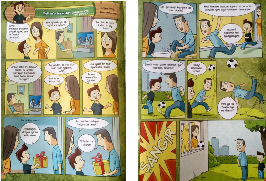
Şekil 4. TRT Çocuk Dergisinde Yayınlanan “Yeşilcan’ın Maceraları” Bölümü

• “Yeşilcan’ın Maceraları” bölümü, Mayıs 2015 sayısından günümüze kadar 2 sayfa olarak yer alan ve değerlerin ve doğru davranışların aşılmasına yönelik çizgi roman niteliğinde bir bölümdür.