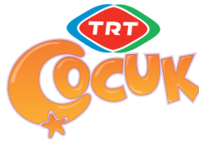
Şekil 1. TRT Çocuk Dergisi Logosu

Bu çalışmada Türkiye’nin kamu yayıncısı TRT ‘nin çocukları hedef kitesine alan TRT Çocuk markasının yayını olan TRT Çocuk Dergisinin içeriği incelenmiş ve Türkiye’de kamu yayıncılığında çocuk dergiciliği ile ilgili bir durum tespit çalışması yapılması amaçlanmıştır.