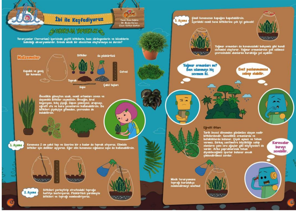
Şekil 11. TRT Çocuk Dergisinde Yayınlanan İbi ile Keşfediyoruz Bölümünün Görseli