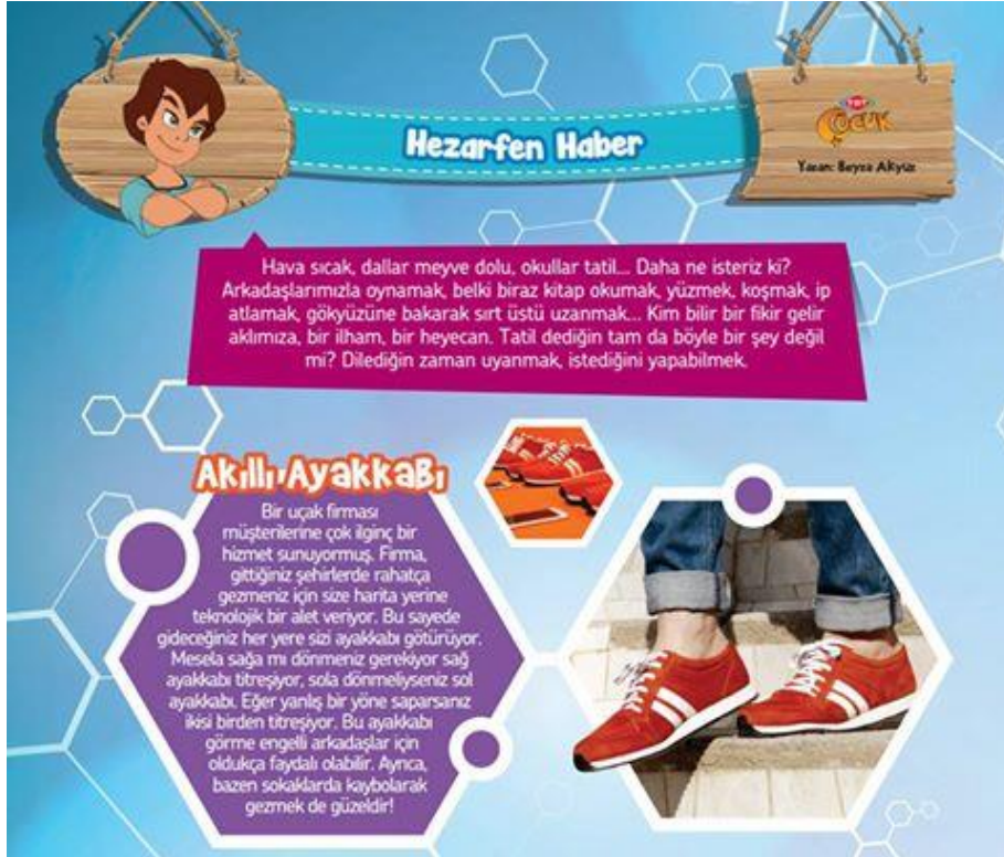
Şekil 7. Hezarfen Haber Bölümünün Görseli

Kapak Konusu ve “Ayşe Usta'nın Atölyesi” / “Çılgıt Hanım'la Tasarım” bölümlerinin aylara göre konuları, Tablo 5'te derlenmiştir. “Ayşe Usta'nın Atölyesi” / “Çılgıt Hanım'la Tasarım” bölümlerinde, çocukların el becerilerini geliştirmeye yönelik, kâğıttan ya da atık malzemelerden oyuncak yapımları anlatılmaktadır. Bu bölümde yapılan el işlerinin tüm aşamaları resimli olarak okuyucuya aktarılmaktadır. Kapak Konusu bölümünde ise derginin kapağında yer alan özel bir konu ile ilgili olarak bilgilendirme amaçlı bir içerik hazırlanmaktadır.